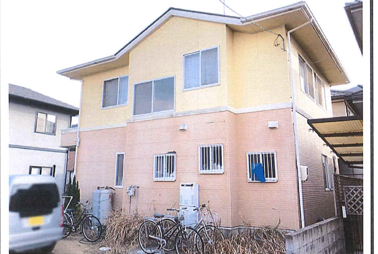
● 中古住宅・農地・田畑 買取・仲介致します。(無料査定)